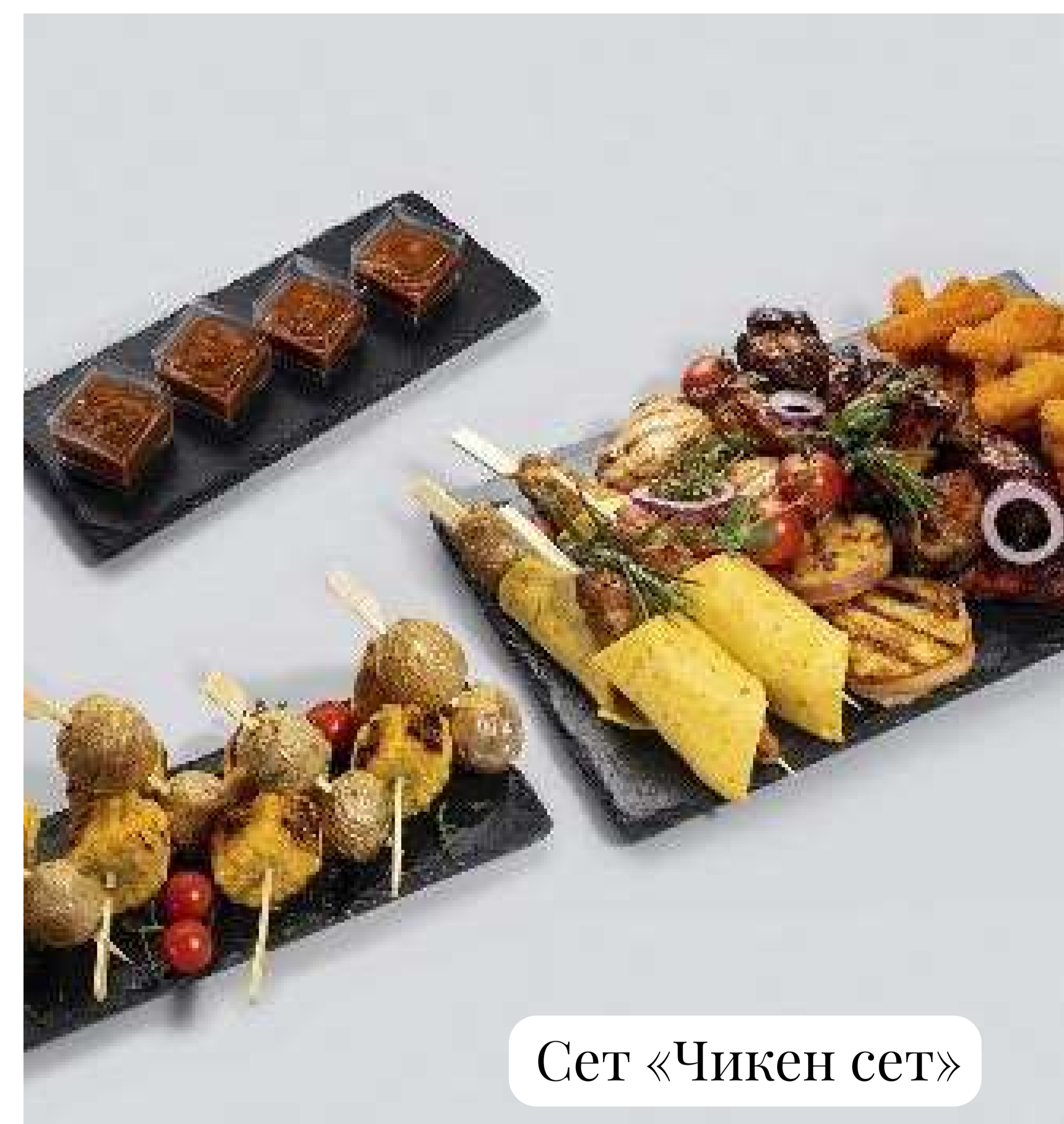
Сет «Чикен сет»