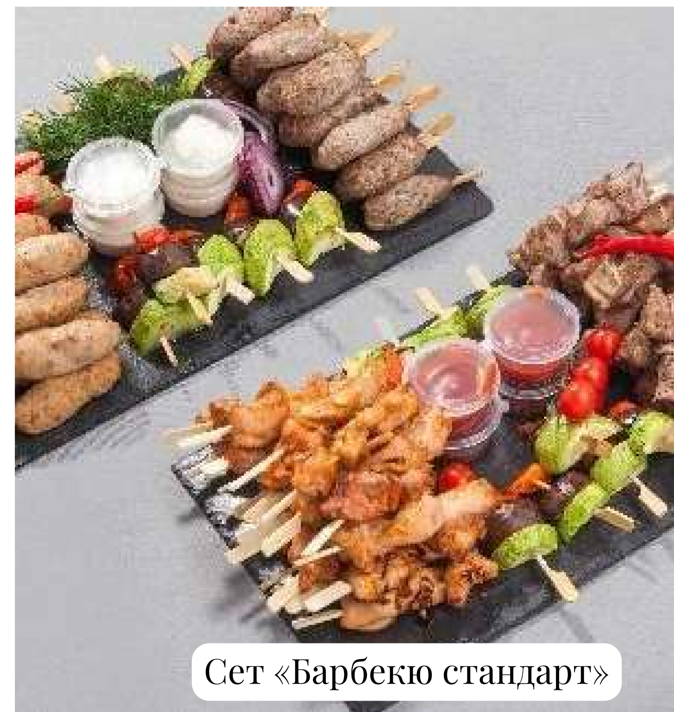
Сет «Барбекю стандарт»