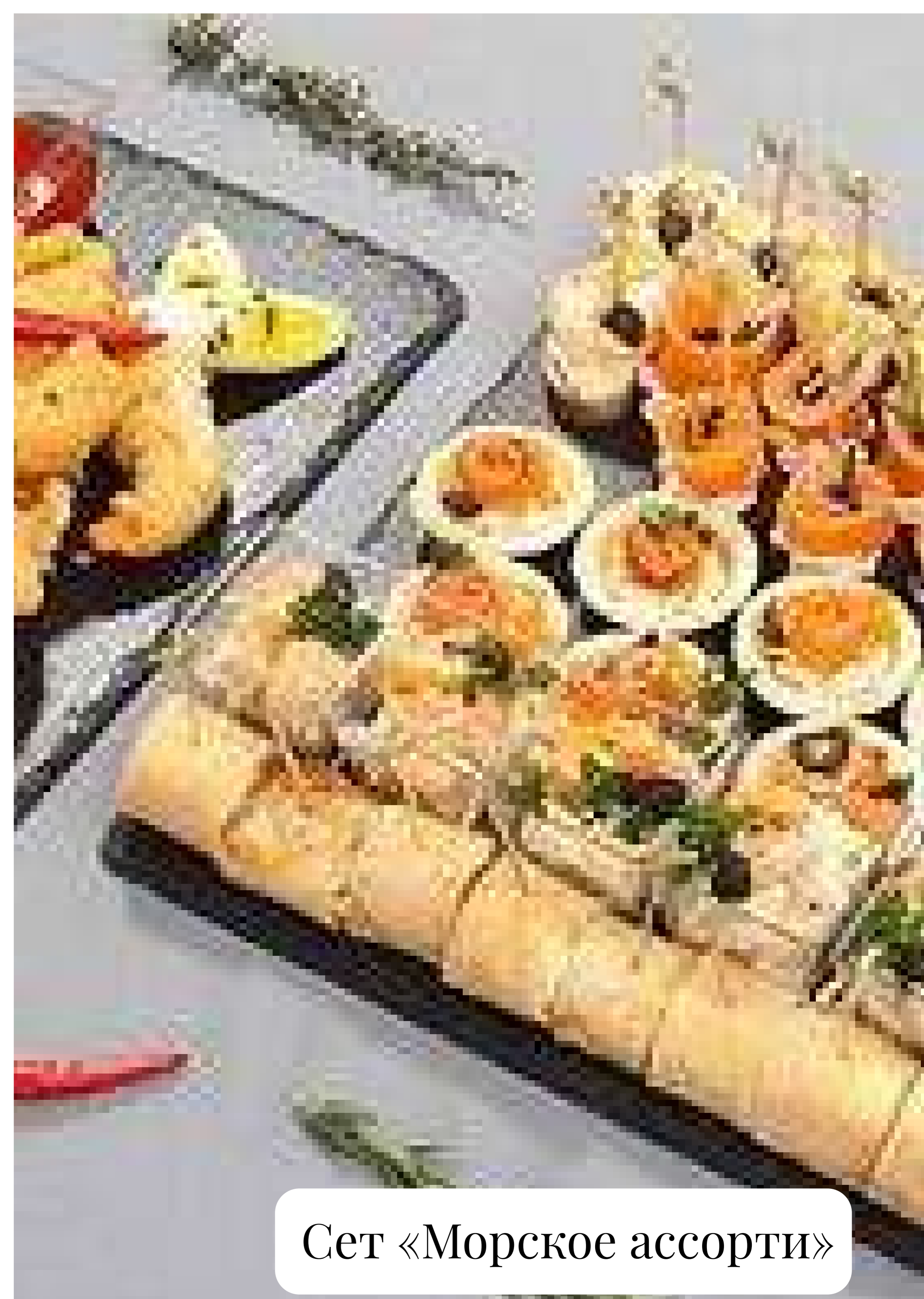
Сет «Морское ассорти»