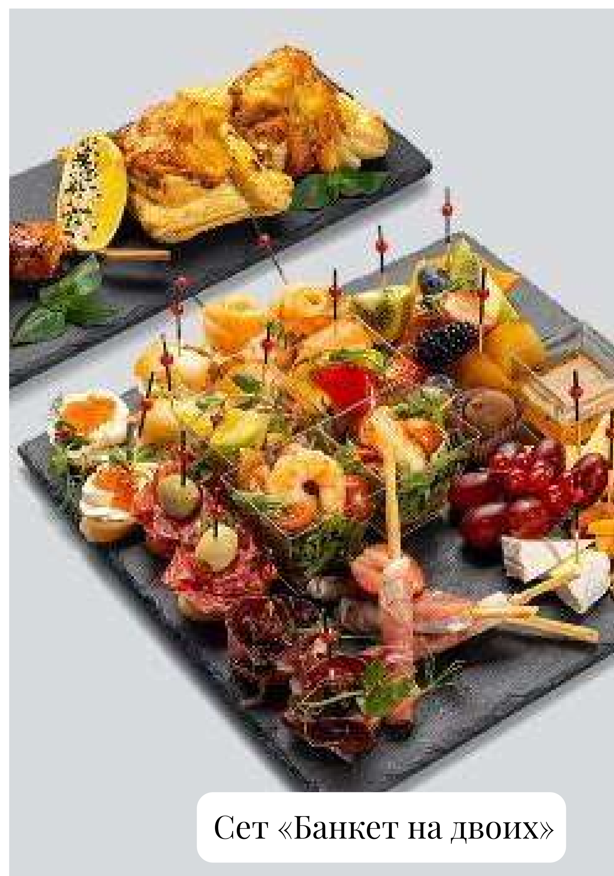
Сет «Банкет на двоих»